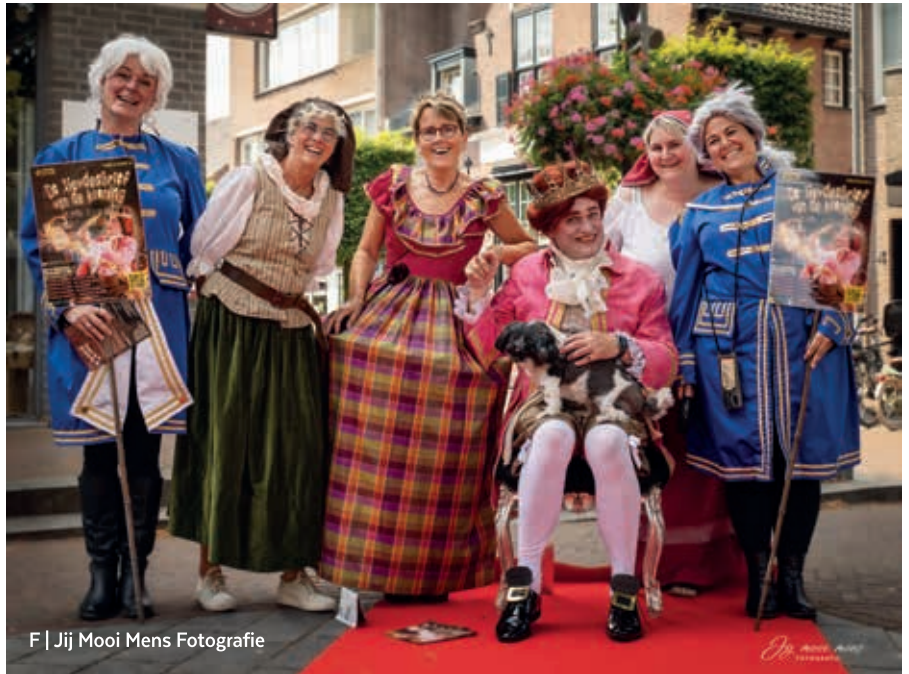
F | Jij Mooi Mens Fotografie

Terwijl de koning met een bang hartje op zoek gaat naar de bibliotheek, leert de operazangeres