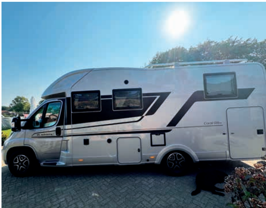
Ons nieuwe (t)huis

En ja, er werd na de bezichtiging een bod uitgebracht. Na een tegenbod te hebben gedaan dat direct werd geaccepteerd een dag later, en 3 dagen voor de afloop van hun vakantie, was het huis verkocht! Nu kon er concreet verder gegaan worden met de plannen. En dat moest snel ook, want Sonja en George hadden zo'n 6 weken om door te pakken en zo goed als hun hele hebben en houden te verkopen. Na 2x een garagesale, het brengen van spullen met een emotionele waarde naar de zolder van Sonja's ouders, 3 ritjes naar de milieustraat en ook een paar ritjes naar de Kringloopwinkel, werd het huis leger en leger. Gelukkig waren er inmiddels een campingtafel en 2 campingstoelen die straks mee zouden gaan op reis, zodat Sonja en George niet op de grond hoefden te zitten. Bij Stamcampers in Dreumel kochten ze hun spiksplinternieuwe camper. Deze camper was