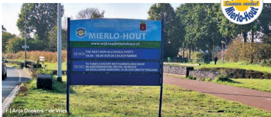
F | Anja Donkers - de Vries